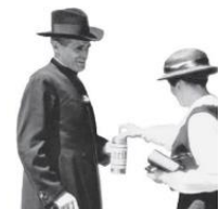
Jesuitenpater Rupert Mayer; Photos der Caritas im Erdbildum, sammelte schon 1923 mit der Caritas-Darleke von St. Michael in der Münchner-Pfaffengasse.